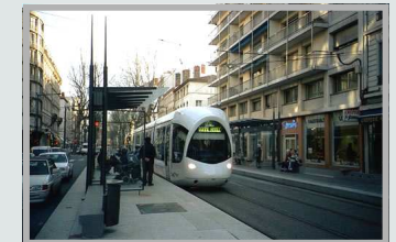
Densifier les quartiers desservis en transports collectifs