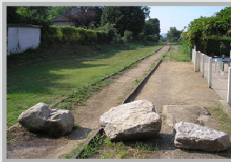
Emprise de la future ligne Lyon-Trévoux

Les Orientations d'aménagement et de programmation* inscrivent les liaisons « modes doux » à prévoir afin de relier les futures opérations aux autres quartiers de la commune.