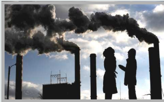
Réduire les émissions de G.E.S.

Les objectifs dévolus au PLU sont désormais :