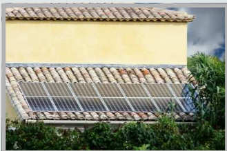
Panneau solaire intégré à l'habitation