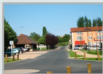
Sécurisation de la traversée de Frans